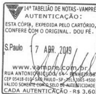
Itamar Zonbro CRC 1SP142095/O-4