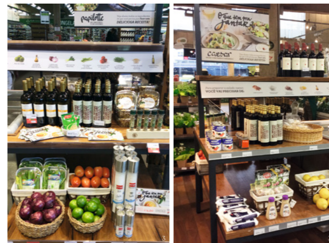
Revista exposta no St Marche junto aos ingredientes usados em receitas da edição

R$ 82.117,11 DOAÇÃO TOTAL R$ 49.181,56 PARA O BANCO DE ALIMENTOS + R$ 32.935,55 PARA A GASTROMOTIVA (beneficiada até a edição 9)